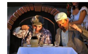
Il "duo" vincitore del premio miglior attore protagonista..

...per aver interpretato i ruoli assegnatigli in perfetta simbiosi sia nelle battute che nelle gestualità e persino nelle intenzioni. Una coppia che ha reso perfettamente il pensiero del "sentire comune" verso i personaggi rappresentati.